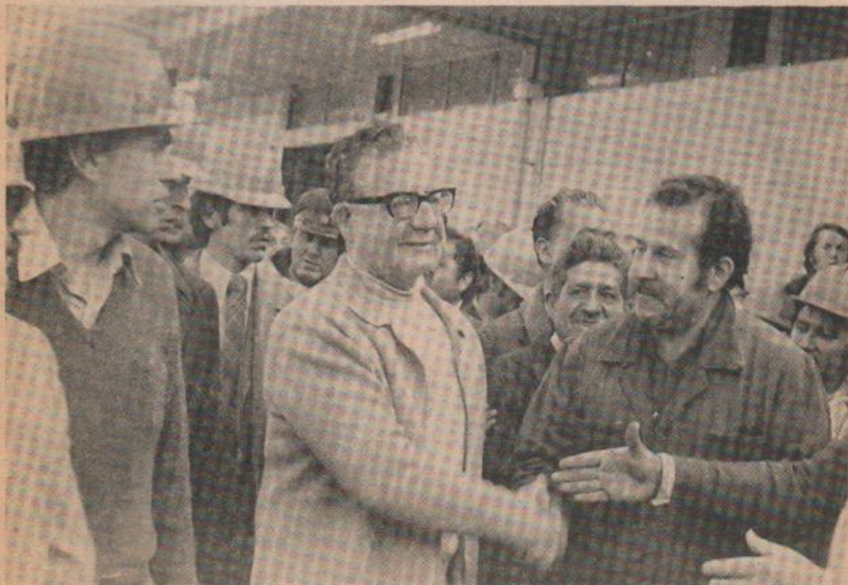
“En Salvador había humanidad, un sentido generoso hacia los seres humanos”.

—Que sin unidad no se puede construir nada. Tiene que ser con unidad y con mucho sacrificio de todos los chilenos como se puede sacar a Chile de