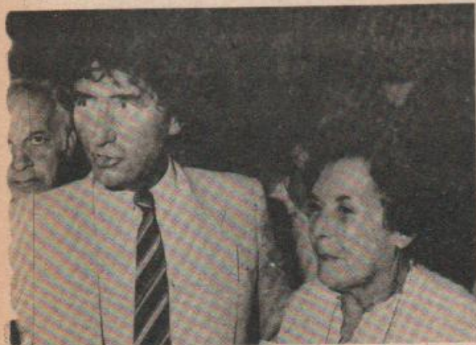
En sus continuas giras por el mundo, con el secretario del Partido Socialista francés.

—¿Cómo no va a estar aislado internacionalmente con todas las brutalidades que se cometen! Para mencionarle sólo un caso reciente, ahí tiene esos allanamientos después de la primera protesta, efectuados al amanecer, en poblaciones con varios miles de personas, haciéndolos alinearse, humillándolos, abusando de personas que no tienen trabajo. ¿No se podía haber evitado todo eso? Pero no: había que amedrentar a la población, humillar la dignidad del poblador, del chileno que ya de por sí está sufriendo mucho, con todo el peso de la cesantía y de las crecientes diferencias sociales. Por eso reaccionó el obispo auxiliar, monseñor Camilo Vial, criticando estas medidas de violencia innecesaria. Fue