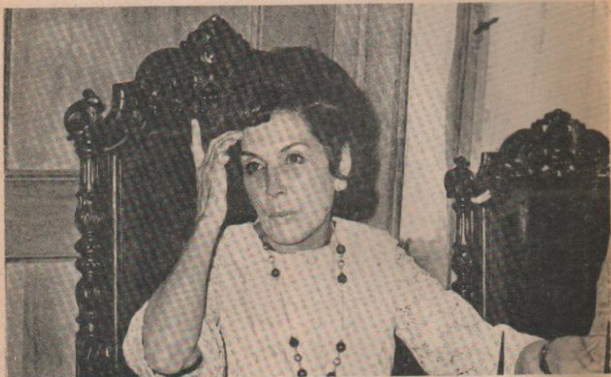
Hortensia Bussi en La Moneda como Primera Dama de la nación.

cés. Yo me fui a acostar porque estaba muy cansada.