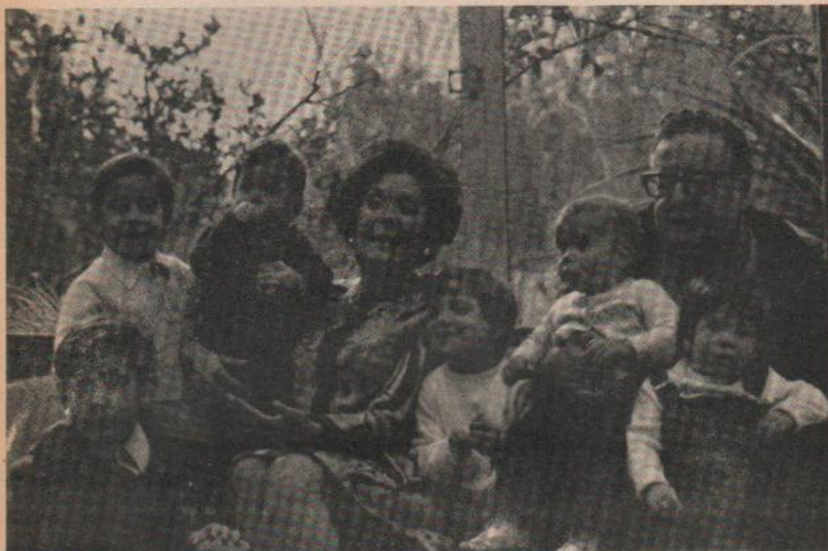
En Tomás Moro, una de las últimas fotos con Allende y los nietos.

ra de Chile el hecho también fue criticado justamente, motivando una protesta de Canadá y las duras palabras del Ministro de Relaciones Exteriores de Francia diciendo que Pinochet era una maldición para su pueblo. Estos actos merecen repulsa. Si Pinochet leyera la prensa internacional se daría cuenta de que la opinión mundial está en su contra.